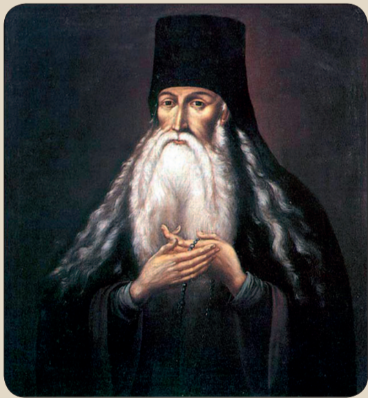
Преподобный старец Паисий (Величковский). Прижизненный портрет

Соблюдайте это, не собирайтесь на кухне, в палатке, в пекарне и во всяком месте без надобности, потому что при многословии не избежим празднословия, смеха и клеветы. Да не ходит один к другому по шалахам без благословной надобности и без благословения духовника, в особенности после поветерия, ибо это святые отцы строго запрещают.