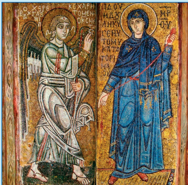
Благовещение. Ок. 1040. Мозаики на двух столбах собора Святой Софии в Киеве

ность, укреплённость в том, что в качестве предмета веры избрало наше сердце. И, наконец, вера – это верность, то есть такой образ жизни, который исключает предательство не только как факт, но даже как