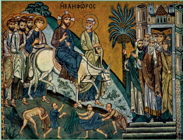
Вход Господень в Иерусалим. Середина XII в. Мозаика Палатинской капеллы в Палермо, Италия

Символика Входа в Иерусалим как бы даже противоречива. С одной стороны, в ней проявлены доказательства Божественности Иисуса Христа, Он выступает в ней как Царь-триумфатор; Его восторженно приветствуют люди. Ему подстилают одежды под ноги. Но, с другой стороны, при этом Он въезжает не на коне, а на молодом осле, символе кротости, а затем добровольно отдаёт Себя неправедному суду Синедриона, идёт на позорную смерть на кресте.